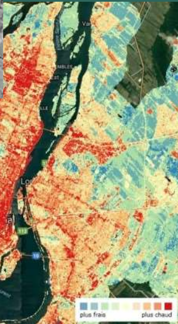
Note: La carte ne montre pas des températures précises, mais plutôt des températures relatives.